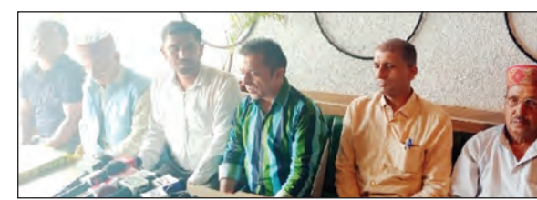
विभाग को भी शिकायतें दी है, लेकिन खनन माफिया की ऊंची पहुंच के चलते कोई भी कार्रवाई अमल में नहीं लाई गई। ग्रामीणों ने कहा कि खनन माफि या द्वारा खदान से डंप गिराया जा रहा है, वह ग्रामीणों के लिए जी का जंजाल बन गया है। ग्रामीणों का कहना है कि बनौर स्थित जेएसटी और बीएसएसआर मीनिंग ओनर द्वारा खनन से निकलने वाले बेस्ट को सरकारी भूमि पर डाला जा रहा है, जिसके चलते न केवल ग्रामीणों की उपजाऊ जमीन बर्बाद हो गई है, बल्कि पानी के प्राकृतिक स्रोत भी खत्म हो रहे हैं। ग्रामीणों ने कहा कि क्षेत्र में लगातार मीनिंग गतिविधियां चल रही है और माइनिंग ओनर द्वारा मीनिंग का मलवा सरकारी भूमि पर गिराया जा रहा है जिसके चलते भूस्खलन का खतरा पैदा हो गया है। मीडिया से रूबरू हुए

कर दिया गया है। ग्रामीणों का आरोप है कि हाई पावर कमेटी द्वारा बनौर स्थित जेएसटी की डिस्पैच होने वाली कंस्ट्रक्शन एक्टिविटीज को तुरंत प्रभाव से बंद करने के निर्देश दिए थे। बावजूद इसके भी डिस्पैच बंद नहीं करवाया गया। ग्रामीणों ने कहा कि उन्होंने कई मर्तबा जिला प्रशासन तथा खनन